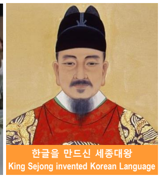
한글을 만든신 세종대왕 King Sejong invented Korean Language