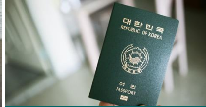
주시카고 총영사관 순회영사업무 The Consulate General Service