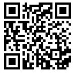
캠프활동 동영상 Camp Video

A 2nd grader student at Minnesota Korean Language Program in KAAM won 13th place in the 2019 Korean Abroad Children's Picture Diary Contest, where 555 children from 44 countries participated around the world. The 15 winners were invited to Korea for a week for Korean History and Culture Camp and took a commemorative photo on August 6th at the Government Complex in Sejong City, South Korea.