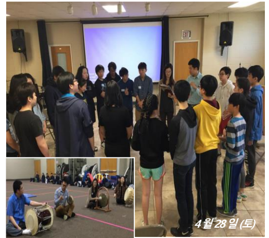
4월 28일 (토)

올해 특별 후원으로 시작한 한인회 청소년 프로그램 KANG (Korean American Next Generation) Leaders 가 지난 4월 28일(토)과 7월 22일(토)에 각각 한인 장로 교회와 한인 회관에서 열렸습니다. 4월 28일에 열린 첫 모임에서는 '정체성과 리더십'이라는 주제로 약 32명의 한인 청소년들과 학부모님들이 참가하였으며 학부모님들을 위한 별도의 모임도 마련되어 자녀 교육이나 진로 정보, 고민과 관심사 등을 서로 나눌수 있었습니다. 또한 검도 시연, 전통 악기 연주로 즐거운 시간이 되었습니다.