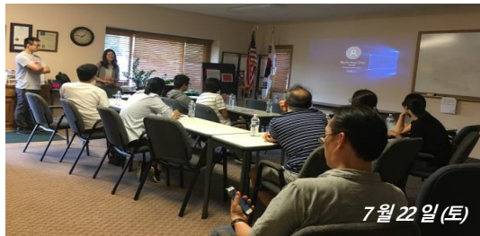
7월 22일 (토)