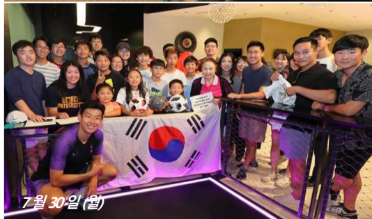
7월 30일 (월)

7월 22일 토요일에는 그 두번째 모임, '대학 진로 워크샵'이 한인 회관에서 있었습니다. 대학 진로와 관련하여 대학 찾기, 지원하기, 장학금 및 재정 보조에 대한 내용을 다루었으며 약 20여명이 참가하였습니다.